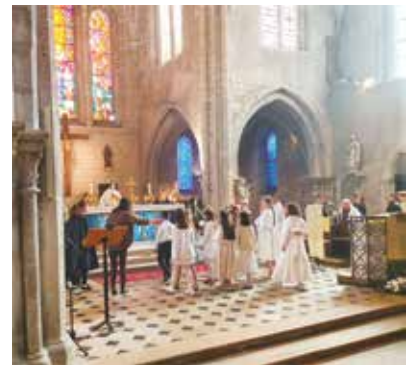
Premières Communions des enfants les 7, 18 et 21 mai.